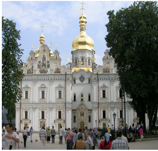
Рис. 4. Відновлений Успенський собор Києво-Печерської Лаври у Києві.