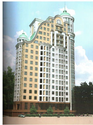
Рис. 9. Будинок у мікрорайоні «Парковий» у Донецьку (арх. Р.Готовцев).

Висновки. Формування нової української міфології є актуальним завданням гуманітарних дисциплін, передусім історії. Сьогодні перелаштовуються міфологічні засади, що поєднують національну культуру, визначаючи процеси розвитку самосвідомості українського народу. Архітектура є дієвим засобом візуалізації нової міфології й завжди є залучена у процес презентації нових міфів суспільства. Одним із міфів, який активно розробляється українськими науковцями, є міф про козаччину, що є одним з небагатьох, який здатний об'єднати сьогоденне українське суспільство. В архітектурі трактування цього міфу презентується специфічними засобами у двох напрямках: відродження найзначущіших храмових споруд, втрачених у період радянської влади, і будівництво нових споруд з використанням форм барокової архітектури. Різні варіанти інтерпретації барокової спадщини ми знаходимо у сакральному будівництві, а також в архітектурі житла.