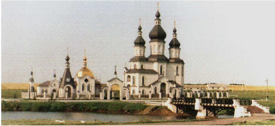
Рис. 7. Церква св. Миколи у с.Чернешина, Харківська обл. (арх. С. Попова, А.Ткаченко).

Пошук сучасного українського стилю також ґрунтується на використанні теми бароко. Показовим є відомий проект житлового комплексу «Хвиля» на вул. Старонаводницькій, 4в у Києві, споруджений у 2000–2001 рр. Я. Вігом (рис. 8). Обмірковуючи прийняте рішення, Я. Віг писав, що його надихнули думки професора Добровольського, який присвятив багато часу розробці теми національного стилю в архітектурі: «...що ж таке національна українська архітектура?... вона, як ніяка інша архітектура світу, – пластична, рукотворна, майстерна. Один з її величних представників Петро Ковнір. Його архітектурні деталі – сандрики, наличники, колонки, орнаменти – настільки індивідуальні, що вважають «скульптурність» національною рисою, яка переросла в українське бароко». Перекладом творчості П. Ковніра на сучасну архітектурну мову і став будинок-«Хвиля», де використано розвинуті карнизи, потужну пластику виступаючих деталей. Українське бароко надихнуло також С. Єжова та В. Селиванова у формуванні стилю житлового будинку на вул. Січневого повстання, 10 у Києві. Барокова тема присутня також в архітектурі східного регіону України, прикладом чого є житловий будинок у мікрорайоні «Парковий» у Донецьку, запроєктований Р. Готовцевим (рис. 9).