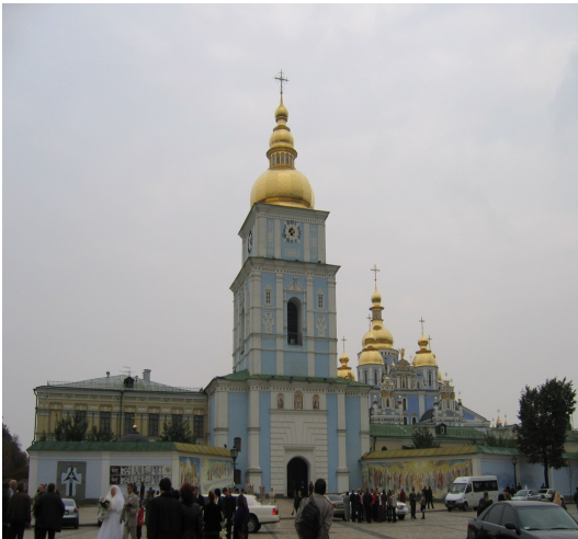
Рис. 3. Відновлений Михайлівський Золотоверхий собор у Києві.

для розвитку сучасної сакральної архітектури України.