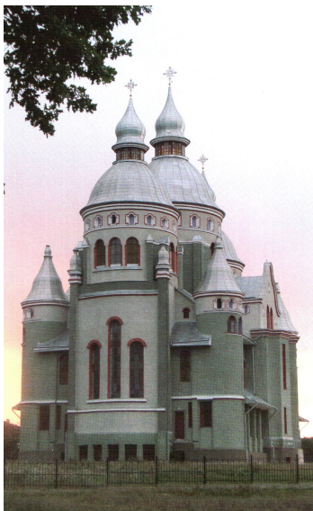
Рис. 5. Греко-католицька церква у с. Бірки біля Львова (1995–2002 рр., арх. М. Рибенчук).

Власне тема козацького бароко є провідною в українському храмуванні й однією з найулюбленіших для новітніх архітектурних експериментів у всіх регіонах України. Прикладами сучасної інтерпретації українського бароко є церква у с. Зубра біля Львова (1992–1995 рр., Р. Сивенький), православна церква і дзвіниця у с. Брюховичі біля Львова (1996–2002 рр., М. Рибенчук), греко-католицька церква у с. Бірки біля Львова (1995–2002 рр., М. Рибенчук) (рис. 5), церква Вознесіння Господнього у Львові (1993–2002 рр., М. Рибенчук), храм в ім'я Св. Жінок-Мироносиць у Харкові (С. і П. Чечельницькі) (рис. 6), церква св. Миколи у с. Чернещина, Харківська обл. (С. Попова, А. Ткаченко) (рис. 7).