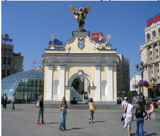
Рис. 2. Лядські ворота на Майдані Незалежності у Києві.

Одним із творчих методів репрезентації міфів в архітектурній практиці є відновлення пам'яток архітектури, хоча цей процес дуже складний і суперечливий, оскільки породжує безліч питань як професійного, так і етико-морального спектра. Однією з найрезонансніших будівельних акцій стала відбудова Михайлівського Золотоверхого собору в Києві (рис. 3), який був зруйнований у 1937 р. для будівництва на цьому місці Урядового центру УРСР. Зі здобуттям незалежності ідею відновлення собору розглядали як важливу суспільно-політичну та культурну акцію. Після проведення детальних археологічних досліджень Михайлівський собор і його дзвіниця були відновлені за проектом Ю. Лосицького у 1997–2000 рр. Другим собором, який відновили завдяки державній програмі відновлення історичної спадщини, став Успенський собор Києво-Печерської Лаври, який у листопаді 1941 р. був підірваний радянськими партизанами. У 1998–2000 рр. Успенський собор був відновлений групою архітекторів та реставраторів під керівництвом О. Граужиса (рис. 4). Обидва собори, побудовані у пишних формах українського бароко, стали орієнтирами