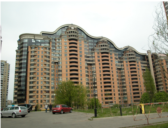
Рис. 8. Будинок – «Хвиля» на вул. Старонаводницькій, 4в у Києві. 2000–2001 рр., арх. Я. Віг.

Пошук сучасного українського стилю також ґрунтується на використанні теми бароко. Показовим є відомий проект житлового комплексу «Хвиля» на вул. Старонаводницькій, 4в у Києві, споруджений у 2000–2001 рр. Я. Вігом (рис. 8). Обмірковуючи прийняте рішення, Я. Віг писав, що його надихнули думки професора Добровольського, який присвятив багато часу розробці теми національного стилю в архітектурі: «...що ж таке національна українська архітектура?... вона, як ніяка інша архітектура світу, – пластична, рукотворна, майстерна. Один з її величних представників Петро Ковнір. Його архітектурні деталі – сандрики, наличники, колонки, орнаменти – настільки індивідуальні, що вважають «скульптурність» національною рисою, яка переросла в українське бароко». Перекладом творчості П. Ковніра на сучасну архітектурну мову і став будинок-«Хвиля», де використано розвинуті карнизи, потужну пластику виступаючих деталей. Українське бароко надихнуло також С. Єжова та В. Селиванова у формуванні стилю житлового будинку на вул. Січневого повстання, 10 у Києві. Барокова тема присутня також в архітектурі східного регіону України, прикладом чого є житловий будинок у мікрорайоні «Парковий» у Донецьку, запроєктований Р. Готовцевим (рис. 9).